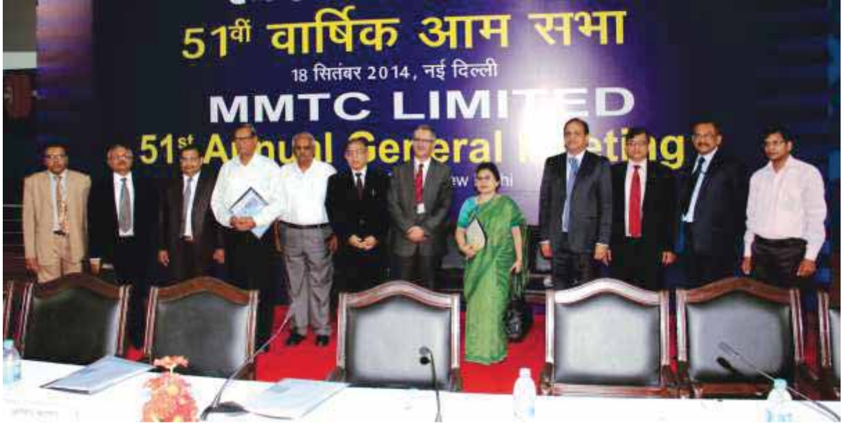
The 51st Annual General Meeting of MMTC was held on Thursday, 18th September, 2014 at the Weightlifting Auditorium in Jawaharlal Nehru Stadium, Lodhi Road, New Delhi.