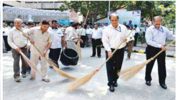
Swachh Bharat Program at MMTC CO

A cleanliness drive was also undertaken at MMTC residential colony in New Delhi under the initiative of the young Deputy Managers living in the colony and door to door collection of garbage and proper placement to facilitate collection of the garbage was shown to all the residents.