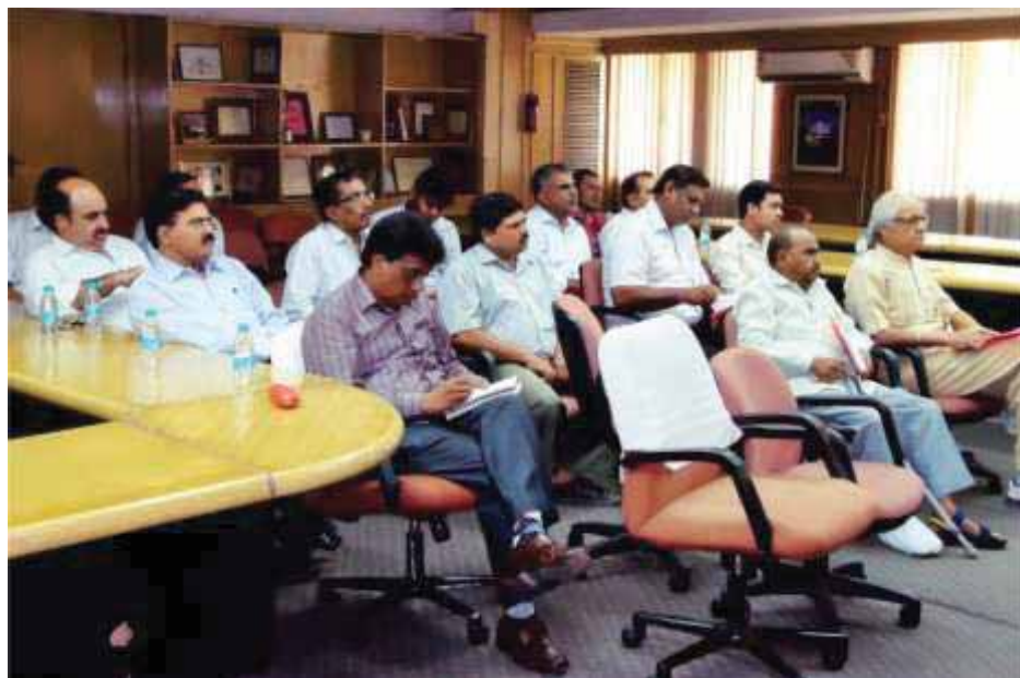
Participants in the programme