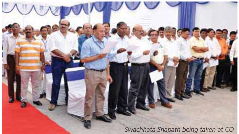
Swachhata Shapath being taken at CO